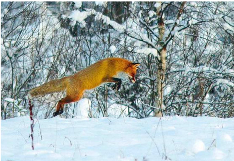
Joonis 1. Jahti pidav rebane (2012)