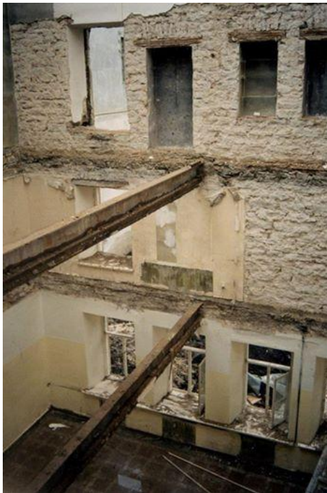
Joonis 11. Gustav Adolphi Gümnaasiumi hoone maikuu 1998. Altpoolt arvates: köögiblokk, õpetajate puhkeruum, klassiruum 220.