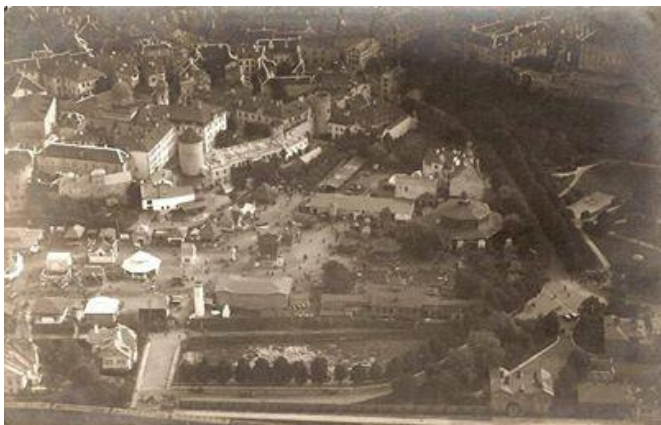
Joonis 9. Kooli ümbrus ja Tallinna näituseväljak 1920. aastate alguses

Olles üle elanud ebastabiilse sõjaperioodi, järgnes reformide ajastu nii hariduses kui üleüldiselt Eesti riigis. Tsaaririigi provintsist oli saanud rahvusriik, mis pidi kohanema uutest oludest tingitud piirangute ja võimalustega. Rahvuslike haridustegelaste rõõmuks oli nüüd võimalus kehtestada üleüldine koolikohustus ning eestikeelne haridus. Siiski ei kaldutud uuenduste tuhinas äärmustesse ning rahvusvähemuste õigused noores Eestis olid kindlustatud. 1920. aastate esimese poole jooksul oli õpilaste arv 400 ringis, mis tolle aja kohta oli märkimisväärselt suur. Teisel kümnendi poolel sai alguse klasside kokkutõmbamine, mis oli tingitud majanduslikest oludest ning vaimse potentsiaali piiratusest. Samal ajal avati Tallinna Poeglaste Täienduskool, kus keskenduti elektri- ja ehitustööle.