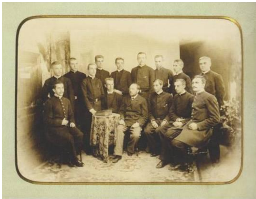
Joonis 6. Tallina Keiser Nikolai I Gümnaasiumi õpilased 1887. aastal

1905. aastal lubati õpilastel väljaspool kooli kanda ka muud riietust, kuid see tühistati kaks aastat hiljem.