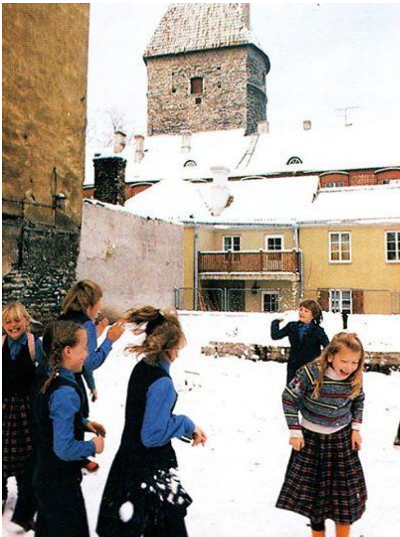
Joonis 10. Tallinna 1. Keskkooli õpilased 1990. aastal

Alates 1981. aastast hakati vene keelt eesti koolides õpetama juba esimeses klassis. Kaheksakümnendate teisel poolel hakkas NSV Liidu kontroll hariduselu üle lõdvenema. Kohalikud haridusorganid ning koolijuhid said rohkem otsustamisõigust. 1980. aastal hakati õpetamisel kasutama arvutit ning 1989. aastal mindi üle 12-klassilisele koolile