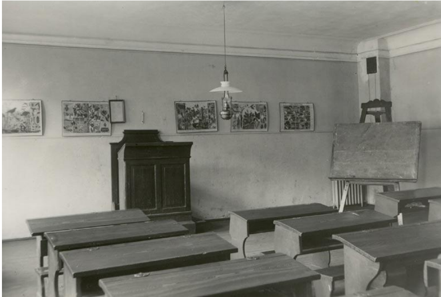
Joonis 7. Klassiruum Nikolai I Gümnaasiumis

Vabal ajal oli õpilastel keelatud käia pidudel, maskeraadidel, klubides, kohvikutes ja trahterites ning võtta väljaspool kooli osa seltside või organisatsioonide tegevusest. Iga kord, kui oli soov külastada teatrit või minna kontserdile, tuli küsida kooli ülemuselt luba. Õpilased võisid vabal ajal tegeleda muusikaga. Koolis tegutsesid tollal koor ja puhkpilliorkester, mõlemasse otsiti igal sügisel lõpetanute asemele esimestest klassidest uusi õpilasi. Kord aastas, tavaliselt detsembrikuus, peeti koolis ka pidu, kus osalesid deklamaatorid, koor ning ka orkester.